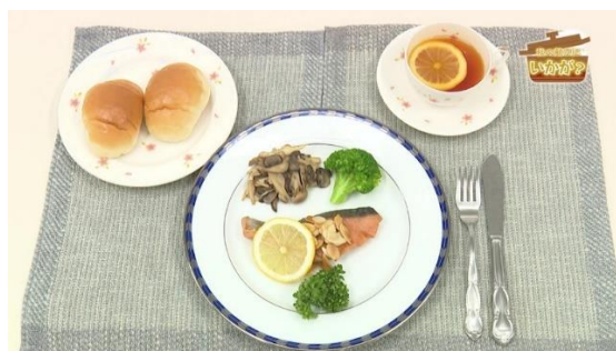
《秋鮭のムニエル～アーモンドソースがけ》