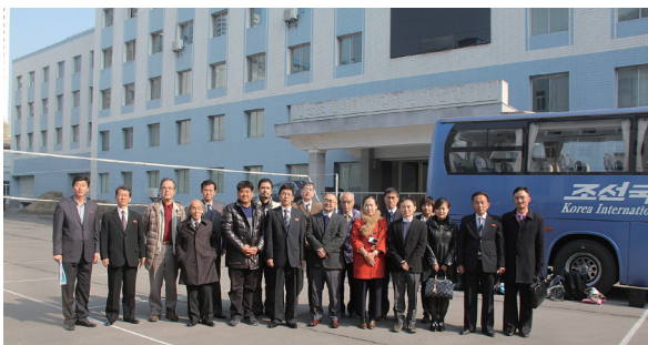
朝鮮社会科学院歴史研究所との学術意見交換会後の集合写真（2016年11月3日）。