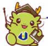
県大マスコットキャラクター オロリン