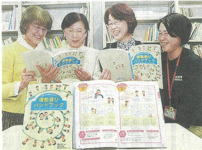
制作した指導本を手に、乳幼児の運動遊びの普及を進めようと意気込むメンバー

完成した指導本「運動遊びハンドブック」では、運動遊びの時の効果的な声掛けなどを紹介。「登り棒」遊びで幼児が「先生、足持って」と発言したことなどの