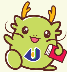
マスコットキャラクター「オロリン」