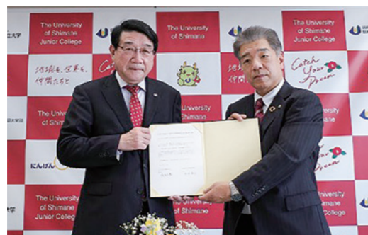
島根県立松江商業高等学校